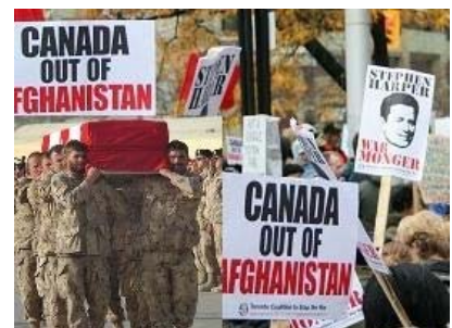
Manifestation au Canada pour le retrait des troupes canadiennes d'Afghanistan